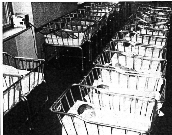
Il "nido" della clinica Ostetrica del Policlinico universitario