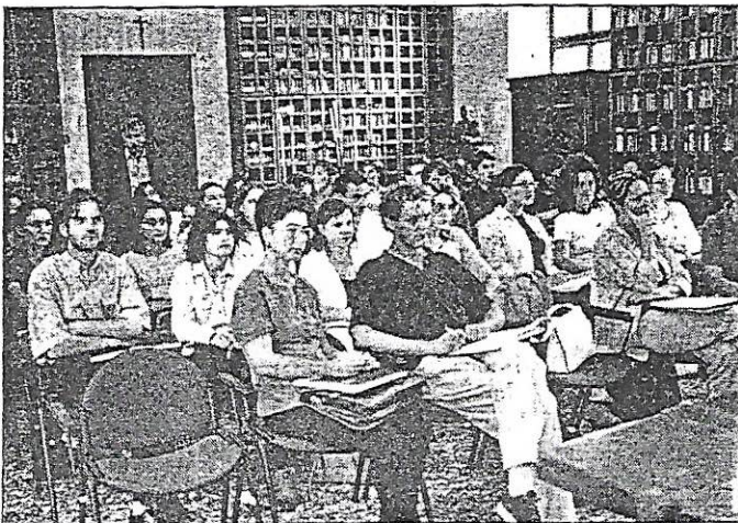
Relatori e partecipanti ai corsi di filologia nella Guarneriana. (F. Gallino)

argomento solo apparentemente lontano dalla nostra realtà storica e culturale, come appunto le lingue baltiche, con cui si trovano invece significative e documentate implicazioni.